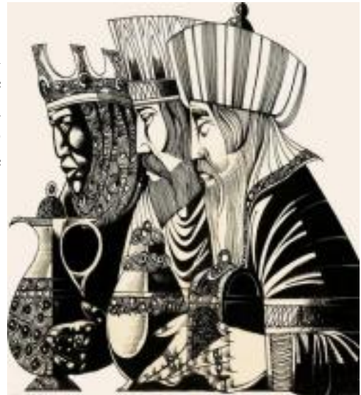
1. KACPER 2. BALTAZAR 3. MELCHIOR

Trzej Królowie, to według tradycji reprezentanci trzech kontynentów. Dopasuj symbole różnych organizacji międzynarodowych, związanych z danym kontynentem odpowiednio do każdego z trzech mędrców oraz podaj pełną nazwę organizacji.